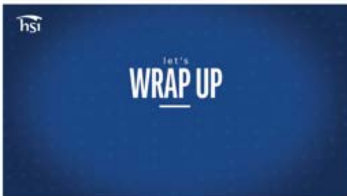
Slide de encerramento da aula