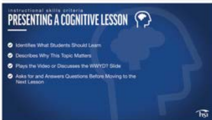
Slide de discussão