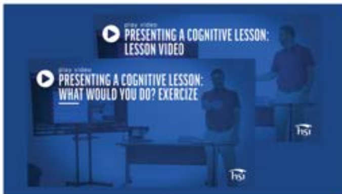
Vídeo para a aula e WWYD? (quando aplicável)