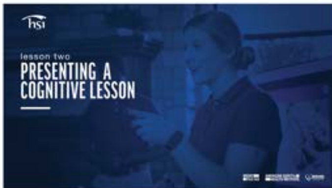
Slide do título

Além deste Guia CDI, a HSI fornece uma Apresentação de Classe CDI que apoia e aprimora o método de treinamento de instrutores em sala de aula tradicional ou virtual (Fig.1). A Apresentação da Aula contém todos os elementos necessários para facilitar a parte presencial do CDI. Para usar essas ferramentas, baixe a apresentação da aula CDI da Otis para reprodução em um computador ou transmita-as ao vivo por meio de uma conexão à Internet com banda larga suficiente. Os TI que utilizam a Apresentação de Classe da CDI se beneficiarão por terem disponíveis os materiais de treinamento em sala de aula mais atualizados da CDI.